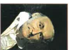
C. F. GAUSS